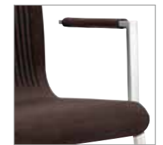
A2020 Platstaal, 30 mm Acier plat, 30 mm