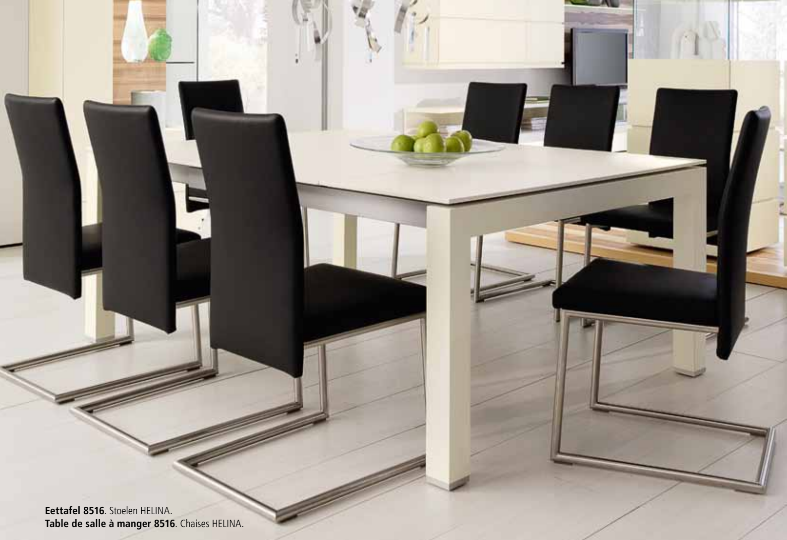
Ettafel 8516. Stoelen HELINA. Table de salle à manger 8516. Chaises HELINA.