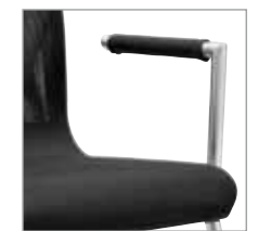
A2030 Ronde buis, ø 25 mm Tubulaire, ø 25 mm