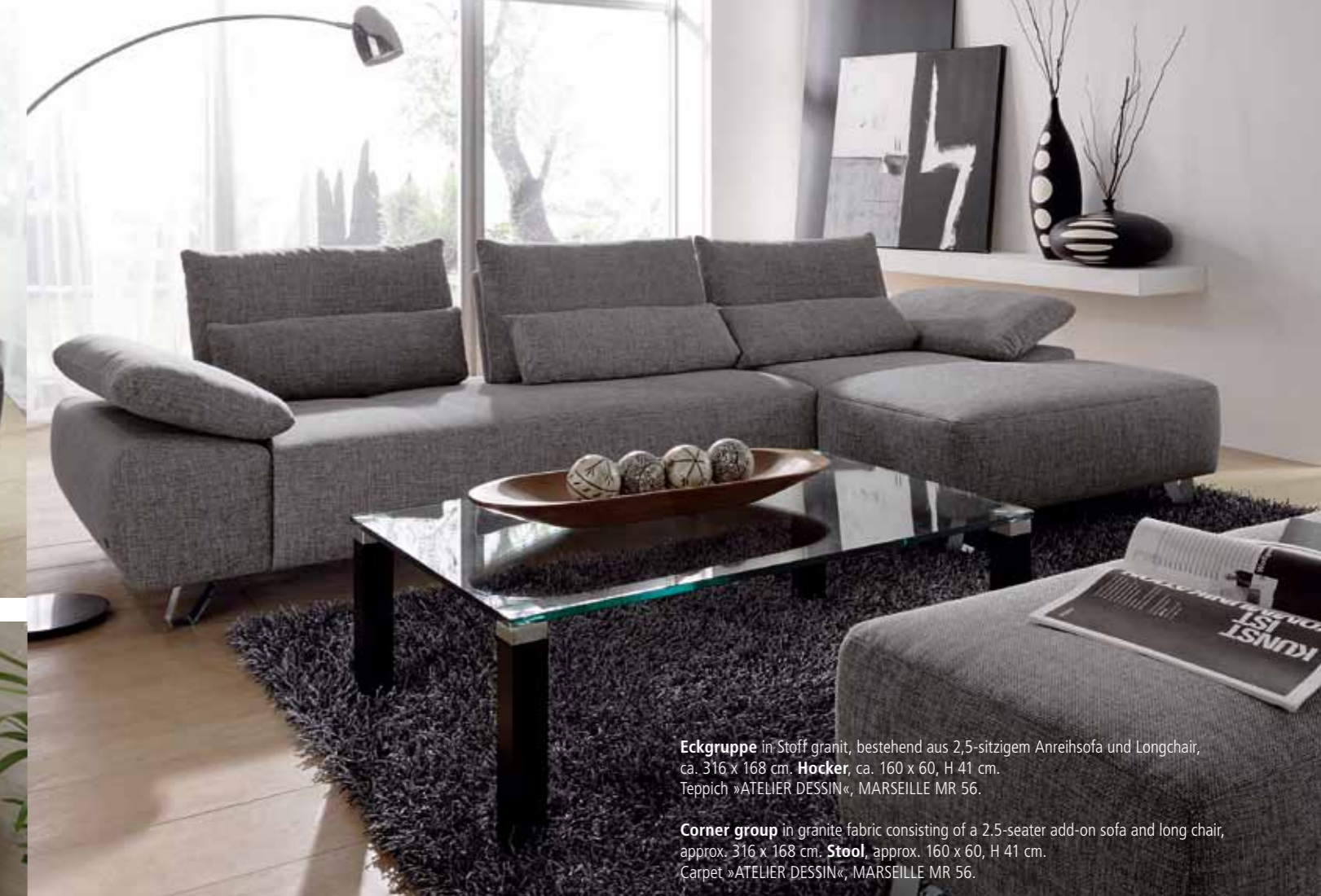
Eckgruppe in Stoff granit, bestehend aus 2,5-sitzigem Anreihsofa und Longchair, ca. 316 x 168 cm. Hocker , ca. 160 x 60, H 41 cm. Teppich »ATELIER DESSIN«, MARSEILLE MR 56. Corner group in granite fabric consisting of a 2.5-seater add-on sofa and long chair, approx. 316 x 168 cm. Stool , approx. 160 x 60, H 41 cm. Carpet »ATELIER DESSIN«, MARSEILLE MR 56.