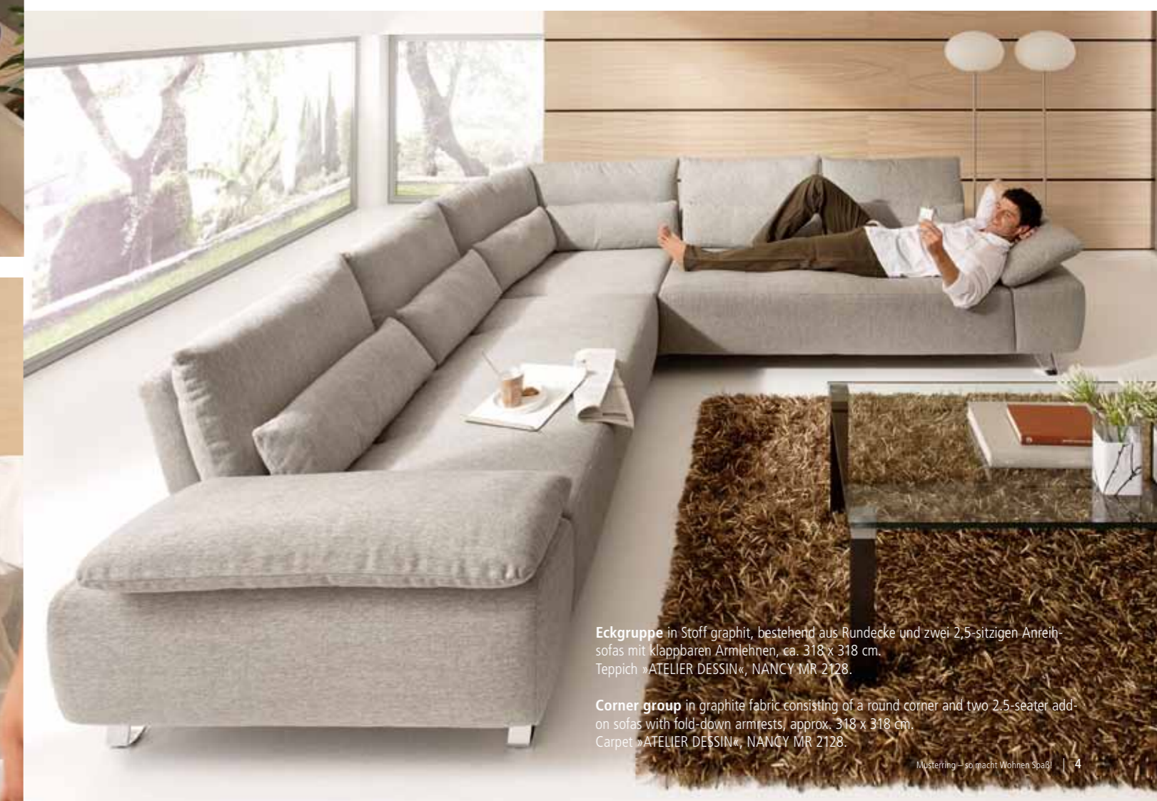
Eckgruppe in Stoff graphit, bestehend aus Rundecke und zwei 2,5-sitzigen Anreihsofas mit klappbaren Armlehnen, ca. 318 x 318 cm. Teppich »ATELIER DESSIN«, NANCY MR 2128. Corner group in graphite fabric consisting of a round corner and two 2.5-seater add-on sofas with fold-down armrests, approx. 318 x 318 cm. Carpet »ATELIER DESSIN«, NANCY MR 2128.