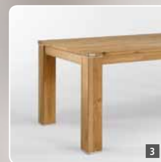
3 Solid wood dining table no. 120 with a high frame