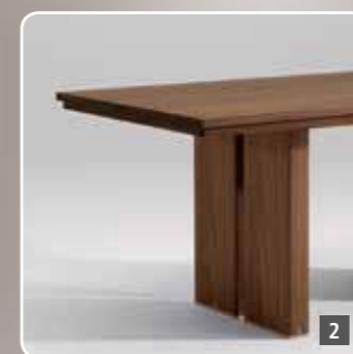
2 Solid wood dining table no. 110 with a flat frame and panel leg