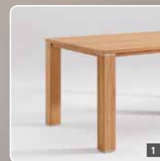
1 Massivholztisch Nr. 110 mit flacher Zarge

4 x stoel Nr. 90, PROVENCE ca. B 46, H 86, ZH 48, D 60 cm; frame: N01 noten naturel geolied; bekleding: Sotega beige.