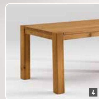
4 Solid wood dining table no. 130 with a flat frame and continuous leg